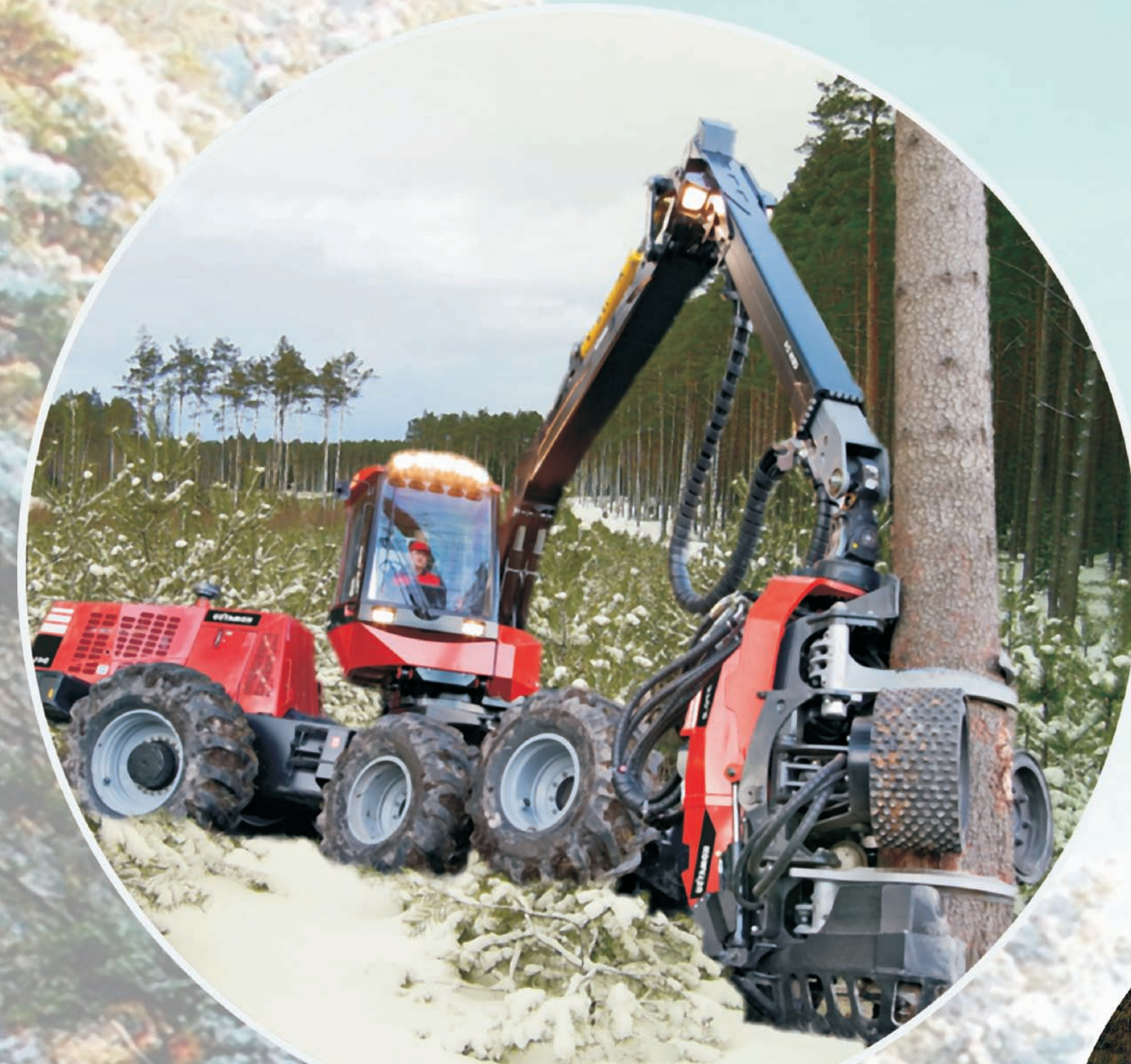
ścinka drzew harvesterem