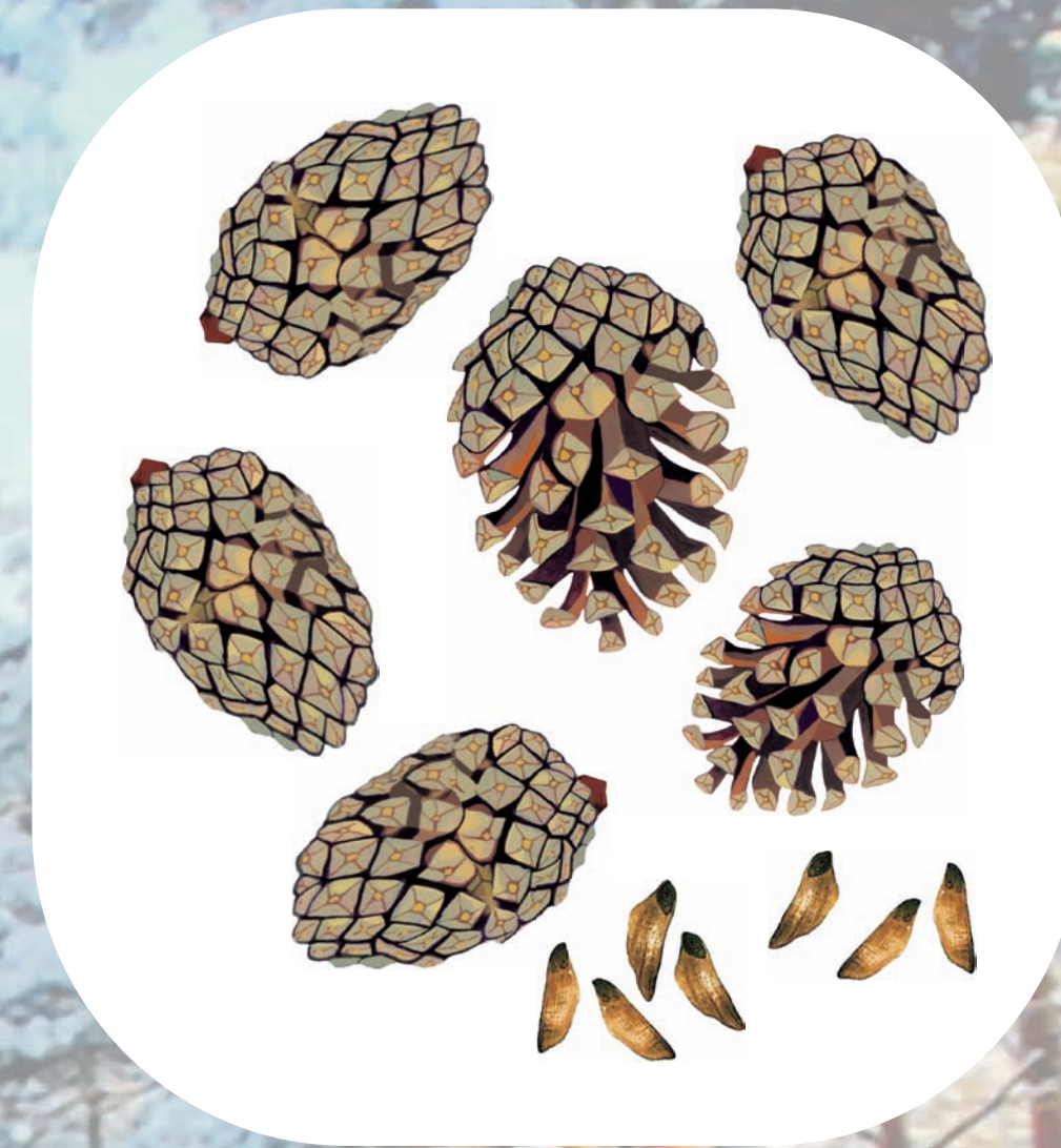
szyszki sosny zebrane w celu pozyskania nasion