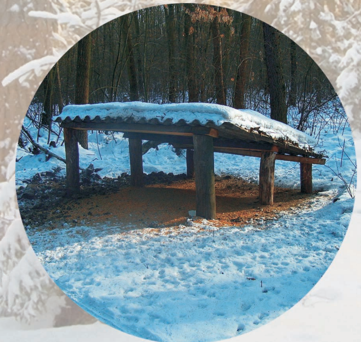
podsypanie z ziarnem dla bażantów