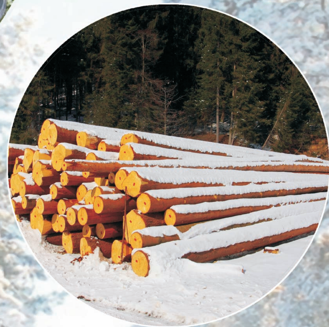
składowanie drewna przed wywozem z lasu