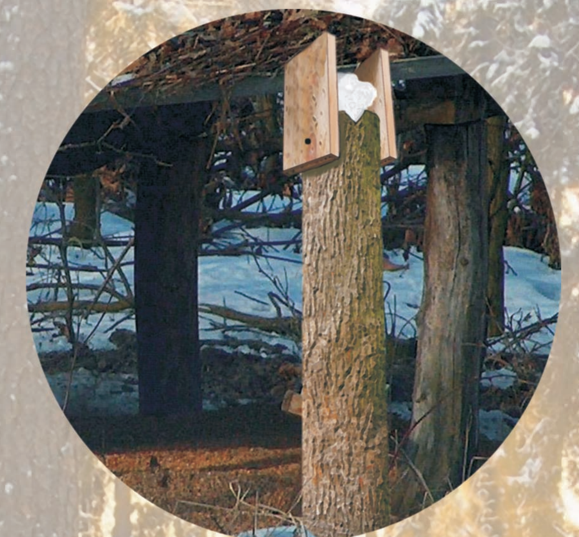
lizawka z solą kamienną przeznaczoną do lizania przez zwierzęta, aby mogły uzupełniać składniki pokarmowe