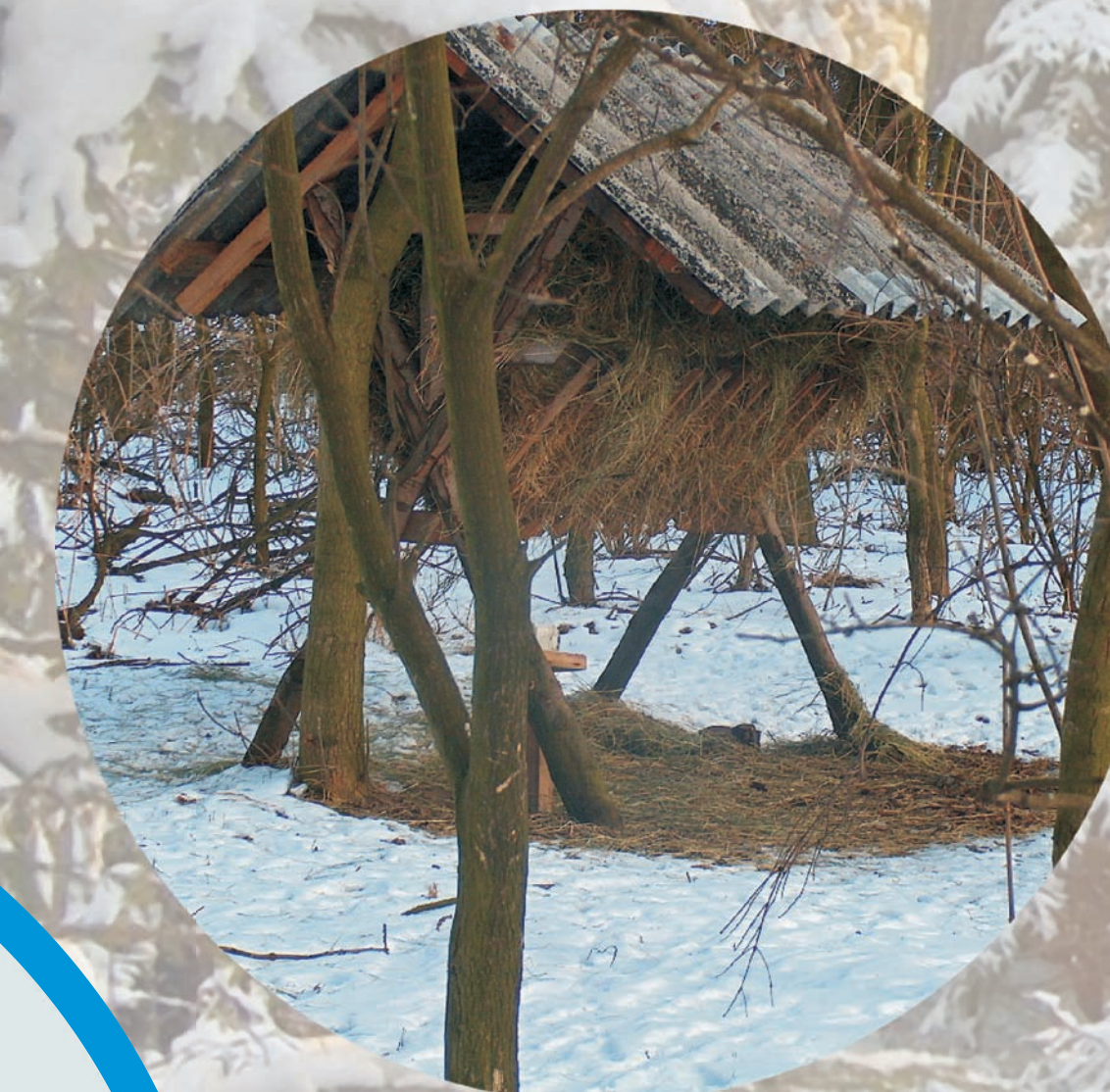
paśnik z karmą dla zwierząt