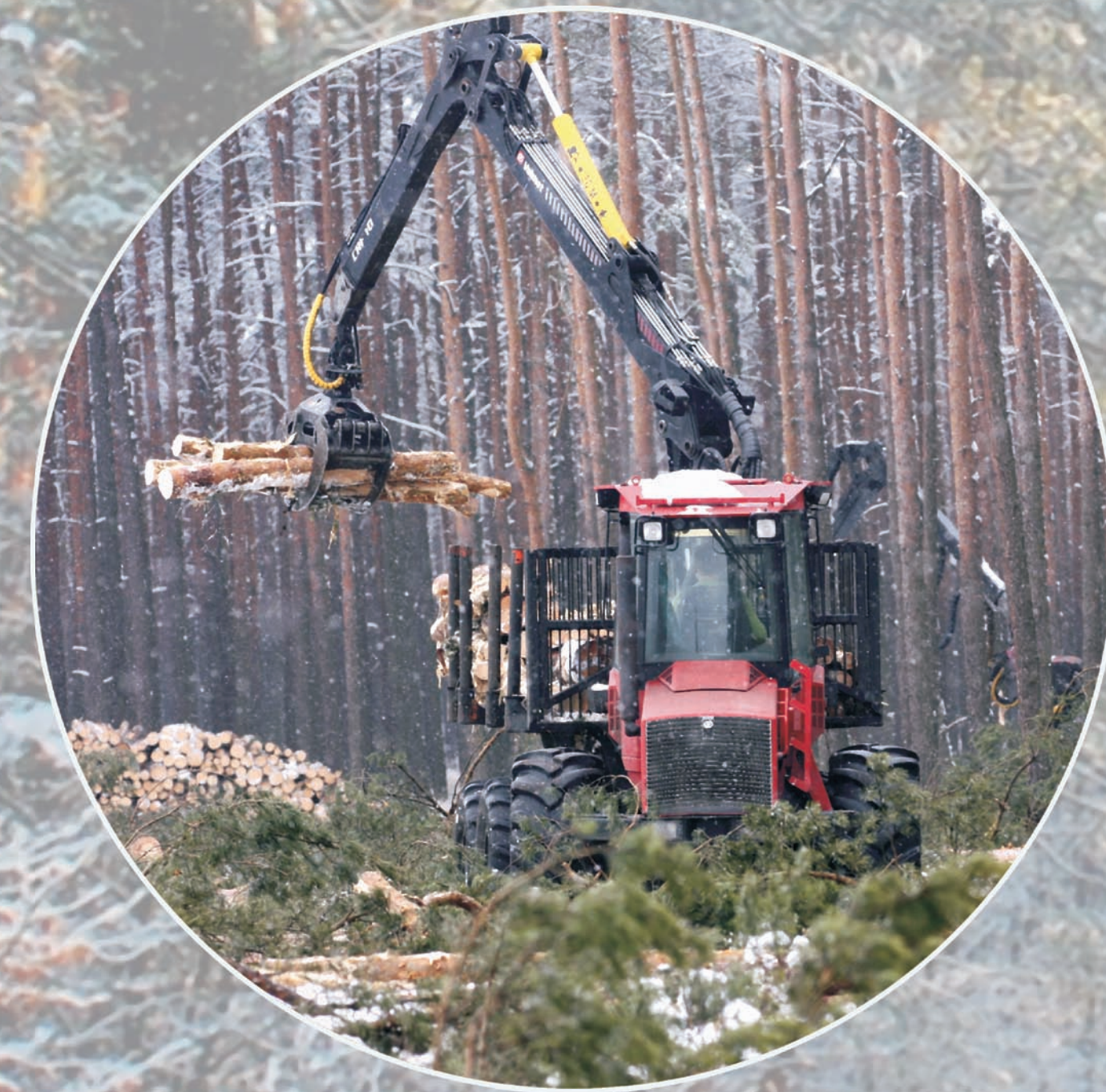
zrywka drewna forwarderem (transport drewna z miejsca pozyskania do miejsca składowania)