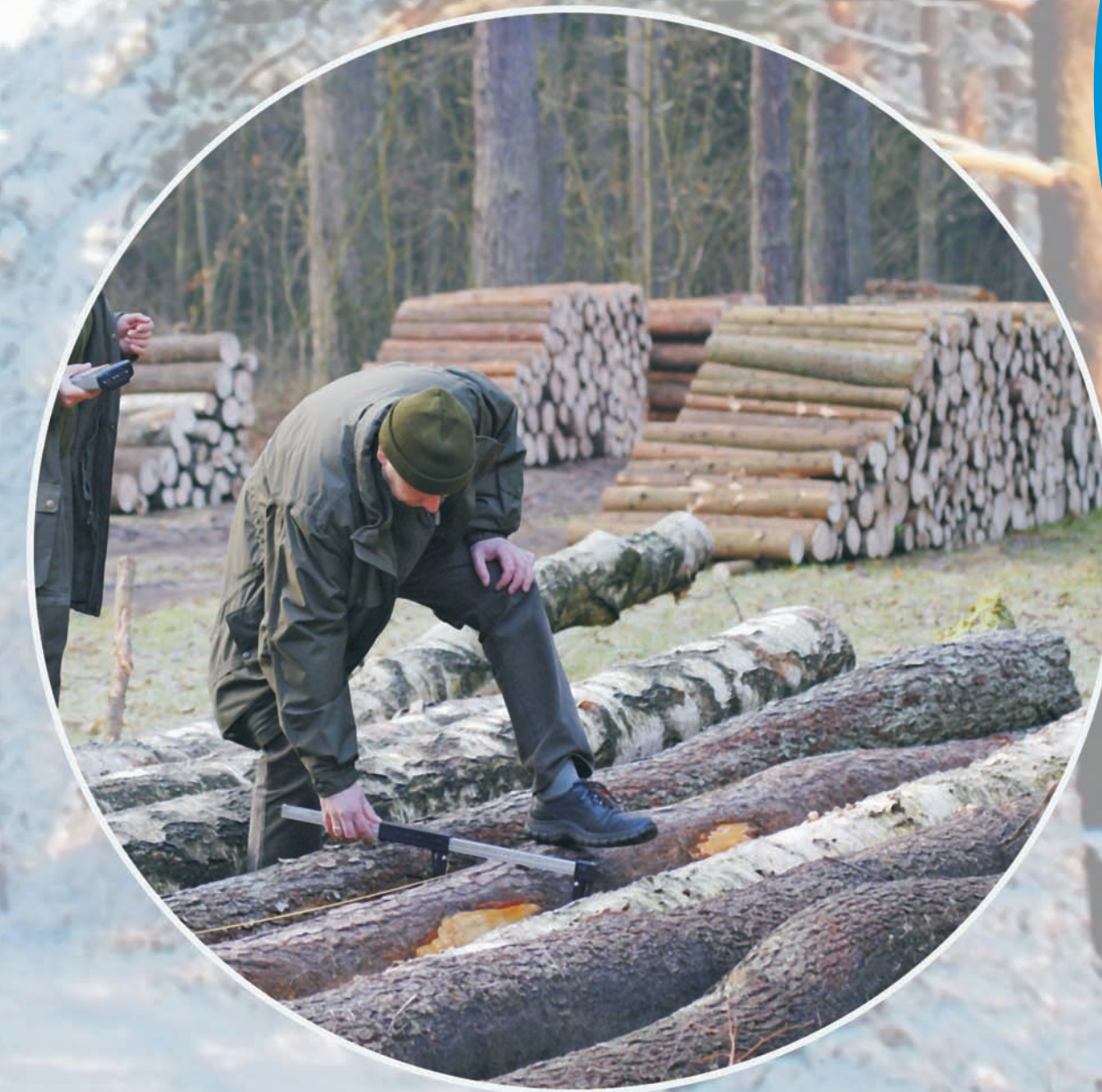
odbiorca drewna (mierzenie, klasyfikowanie i numerowanie drewna oraz wprowadzanie parametrów drewna do rejestratora leśniczego)