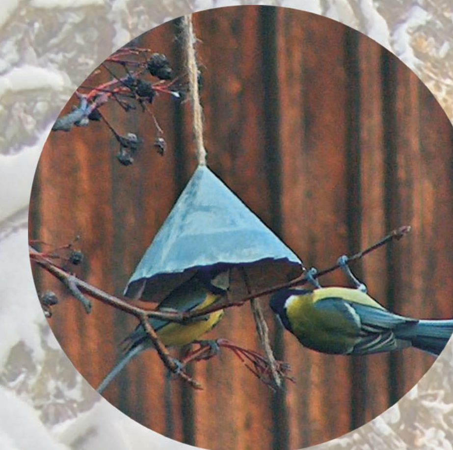
karma dla ptaków zawieszona pod osłoną